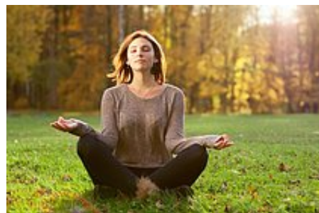
Czy katolik może medytować?