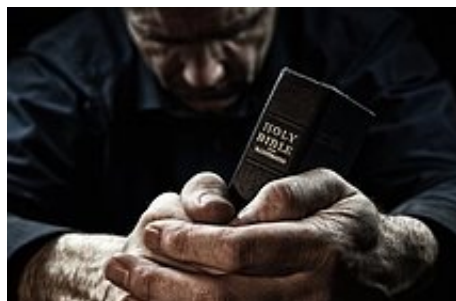
Dlaczego tylu ludzi nie słyszało o Bogu?