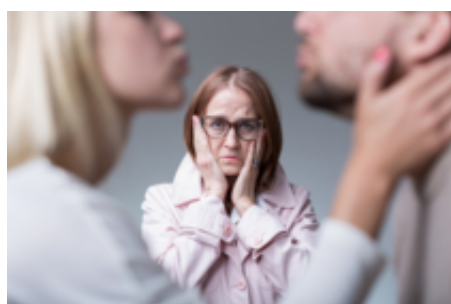
Jak stracić teściową? 6 (niestety efektywnych) sposobów